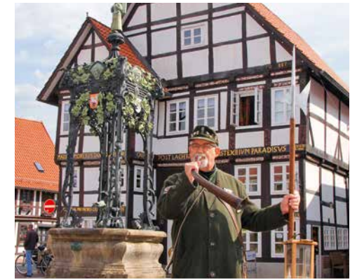
Nachtwächter vor dem Peterschen Haus

Die vier Wanderrouten rund um das Naturfreundehaus »Deisterhütte« sind immer ein beliebtes Familienziel! Die einzelnen Touren sind mit tierischen Motiven gekennzeichnet und haben unterschiedliche Längen. Der Rundweg »Vogel« misst etwa 2 km und ist mit Kinderwagen oder Rollstuhl leicht zu erkunden. Gleichzeitig ist er Wald- und Vogellehrpfad und etwa 30 Nistkästen sind für die verschiedensten Vogelarten am Wegesrand angebracht.