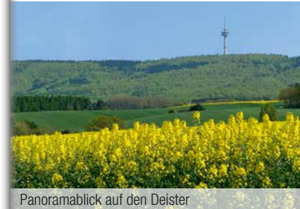
Panoramablick auf den Deister

Martinimarkt der Stadt Rodenberg Jedes Jahr im November