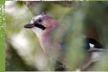
Die Vogelwelt im Deister entdecken

Ob lichte Buchenwälder oder dunkle Fichtengebiete, der Deister bietet vielfältige Lebensräume für Insekten, Wild und Vogelwelt. So sind hier Wildschwein, Fuchs und Reh heimisch, aber auch Eichhörnchen und Buntspecht sind in den Baumkronen zu beobachten. Je nach Lichteinfall entwickeln sich Farne, Moose und Kräuter. Einige von ihnen sind nahrhaft und essbar. Dennoch sollte man sich vorher fachkundig informieren und im Einklang mit der Natur nur kleine Mengen zum Eigenverzehr pflücken.