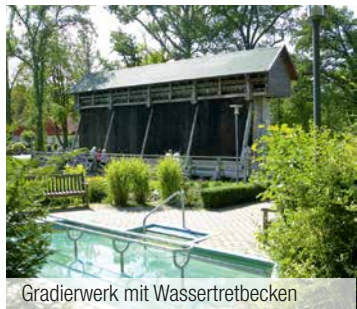
Gradierwerk mit Wassertretbecken

Südwestlich, am Fuße des Deisters lädt die Kurstadt Bad Münster mit ihrer historischen Innenstadt, dem besonderen Kur- und Landschaftspark mit Gradierwerk und den berühmten Heilquellen (Sole, Bitter, Eisen und Schwefel) zum Erkunden ein.