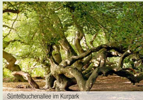
Süntelbuchenallee im Kurpark

Am schönsten Platz im Kurpark steht ein klassizistisches Schlösschen. Bereits Napoleons Bruder Jérôme feierte in dem Gebäude, das auch heute noch eine gefragte Eventlocation ist, rauschende Feste. Die Süntelbuchenallee im Kurpark ist die weltweit einzige Formation dieser Art von alten Süntelbuchen. Dabei handelt es sich um eine seltene Form der Rotbuche, die vor über hundert Jahren angepflanzt wurde. Aber auch die seltenen Taschentuchbäume und die gigantischen Mammutbäume sind lohnende Ziele in der Parkanlage von Bad Nenndorf.