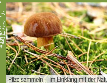
Pilze sammeln – im Einklang mit der Natur