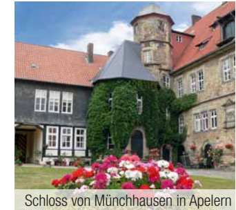
Schloss von Münchhausen in Apelern