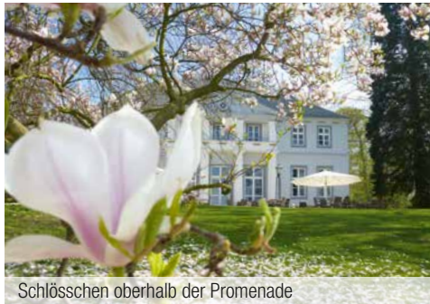
Schlösschen oberhalb der Promenade

Das prädikatisierte Moor-, Schwefel- und Soleheilbad liegt landschaftlich reizvoll zwischen den Höhenzügen Deister und Bückeberge. Moderne Gesundheitsdienstleister sowie die weitläufige Parkanlage mit altem Baumbestand und Wasserspielen laden Sie zu einer Auszeit vom Alltag ein.