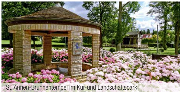
St. Annen-Brunnentempel im Kur- und Landschaftspark