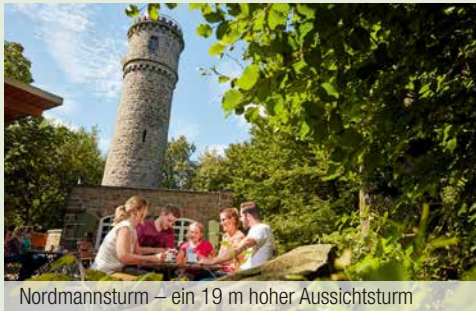
Nordmannsturm – ein 19 m hoher Aussichtsturm

Lust auf einen kulinarischen Stopp am Wegesrand? Unsere Tipps zu Waldgaststätten und Biergärten bieten viele schöne Möglichkeiten, um nach Wander- oder Fahrradtour mitten in der Natur zu entspannen.